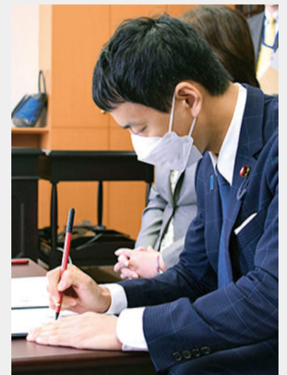
新旧政務官の引継ぎ文書へ署名