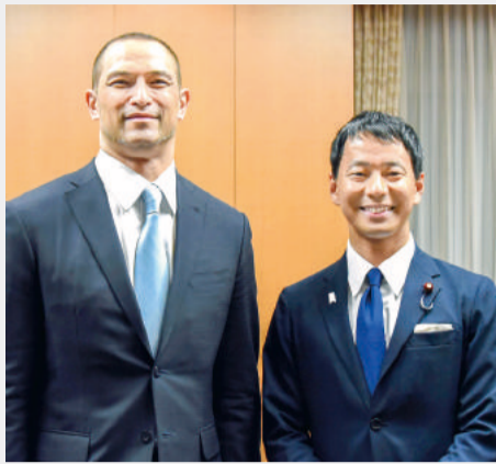
室伏広治スポーツ庁長官との再会