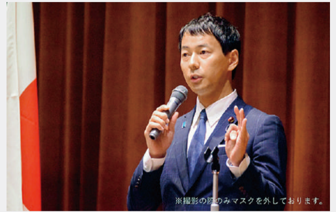
文部科学省にて引継ぎ式の後、職員の皆様へ「夢を与える事が出来る行政が文科省」であり、一緒に取り組んで参りたい旨、ご挨拶させていただきました ※撮影の際のみマスクを外しております。