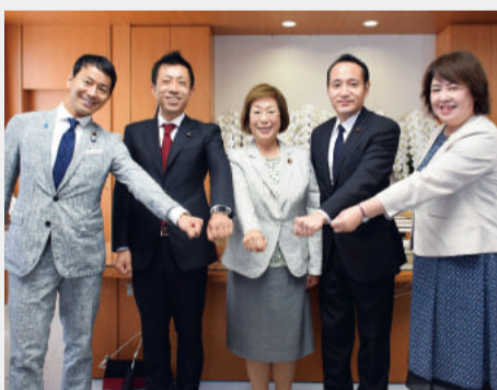
文部科学大臣・副大臣・政務官の政務三役初顔合わせにて記念撮影

が国の研究力が、国際的に年々落ちてきていることに強い危機感を持っています。担当大臣政務官として科学技術力、研究力を高めて、日本が世界をリードする科学技術立国の実現を目指して参ります。国宝など有形文化財や伝統芸能や地域のお祭りなどの無形文化財などをはじめ、漫画やアニメ、現代アートやエンタメなど世界に誇る日本の魅力的なコンテンツの世界的発信や価値の向上など文化立国の実現に向けて取り組んで参ります。