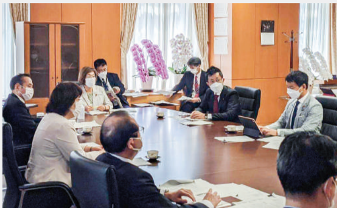
大臣・副大臣・政務官による就任後初めての政務三役会議に参加致しました