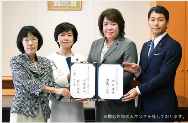
文部科学大臣政務官就任の辞令をうけ、新旧政務官の引継ぎ式が行われました ※撮影の際のみマスクを外しております。