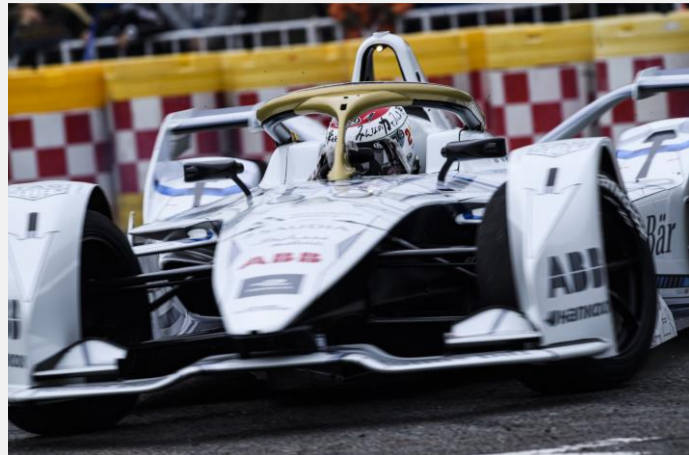
モータースポーツジャパン2022お台場特設会場にてフォーミュラーEでデモンストラクションラン。