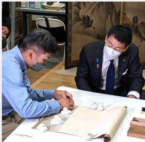
文科政務官として東京国立博物館を視察。修理技術者の匠の技を拝見。