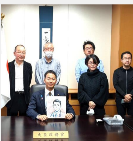
アニメ業界の皆様とアニメの著作権等について意見交換。