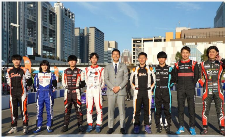
全日本カート選手権EV部門第6戦（最終戦）にて開会宣言。選手の皆さんとスタート前の一枚。