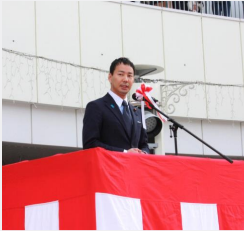
令和5年豊橋市消防出初式にて挨拶