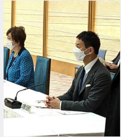
総理官邸にて福島国際研究教育機構(F-REI)の設立準備状況についての復興推進会議に復興大臣政務官として出席