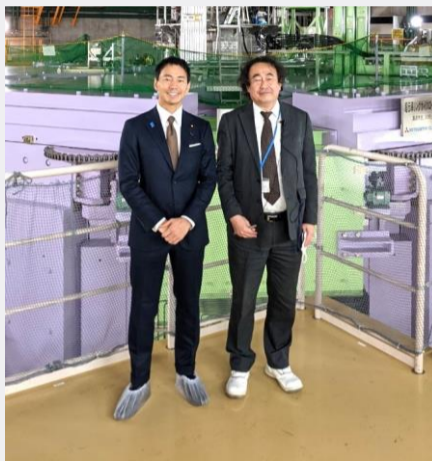
日本で唯一の自然科学総合研究機関として、物理学、工学、化学、計算科学、生物学、医科学など広い分野の研究を進めている理化学研究所を文部科学大臣政務官として視察