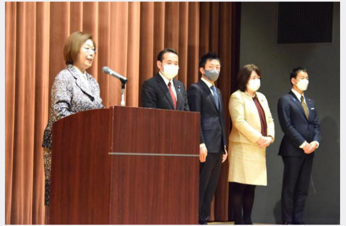
文部科学省にて、永岡桂子文部科学大臣はじめ築和生副大臣、井出庸生副大臣、伊藤孝江政務官の政務三役での新年年頭あいさつ