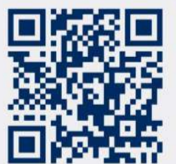
H.P. YouTube Twitter Facebook Instagram